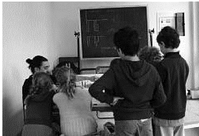
Uno spazio di «AmbienteConoscenza», laboratorio per i ragazzi