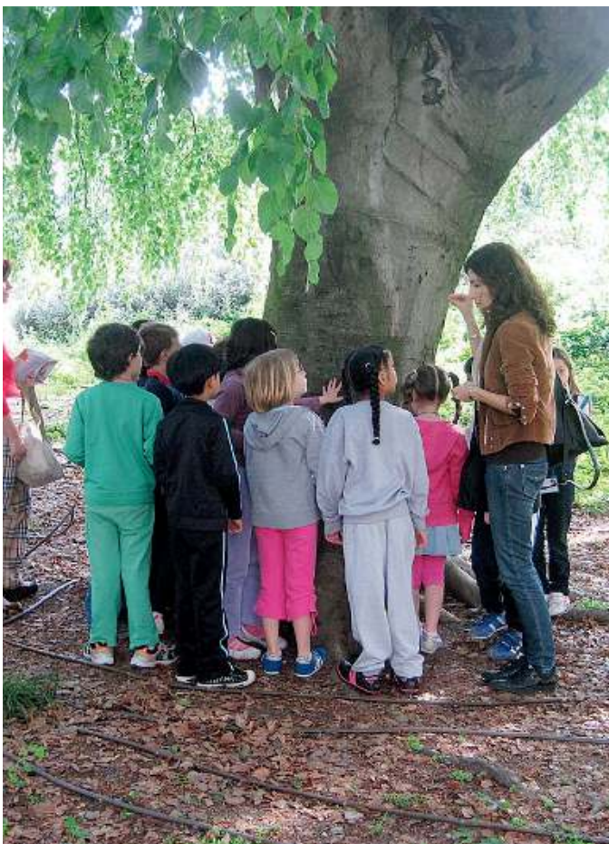
In alto a destra, una veduta del Parco dell'Acqua «Asm Gianni Panella», in città. Qui sopra, due momenti di iniziative organizzate da Ambiente Parco