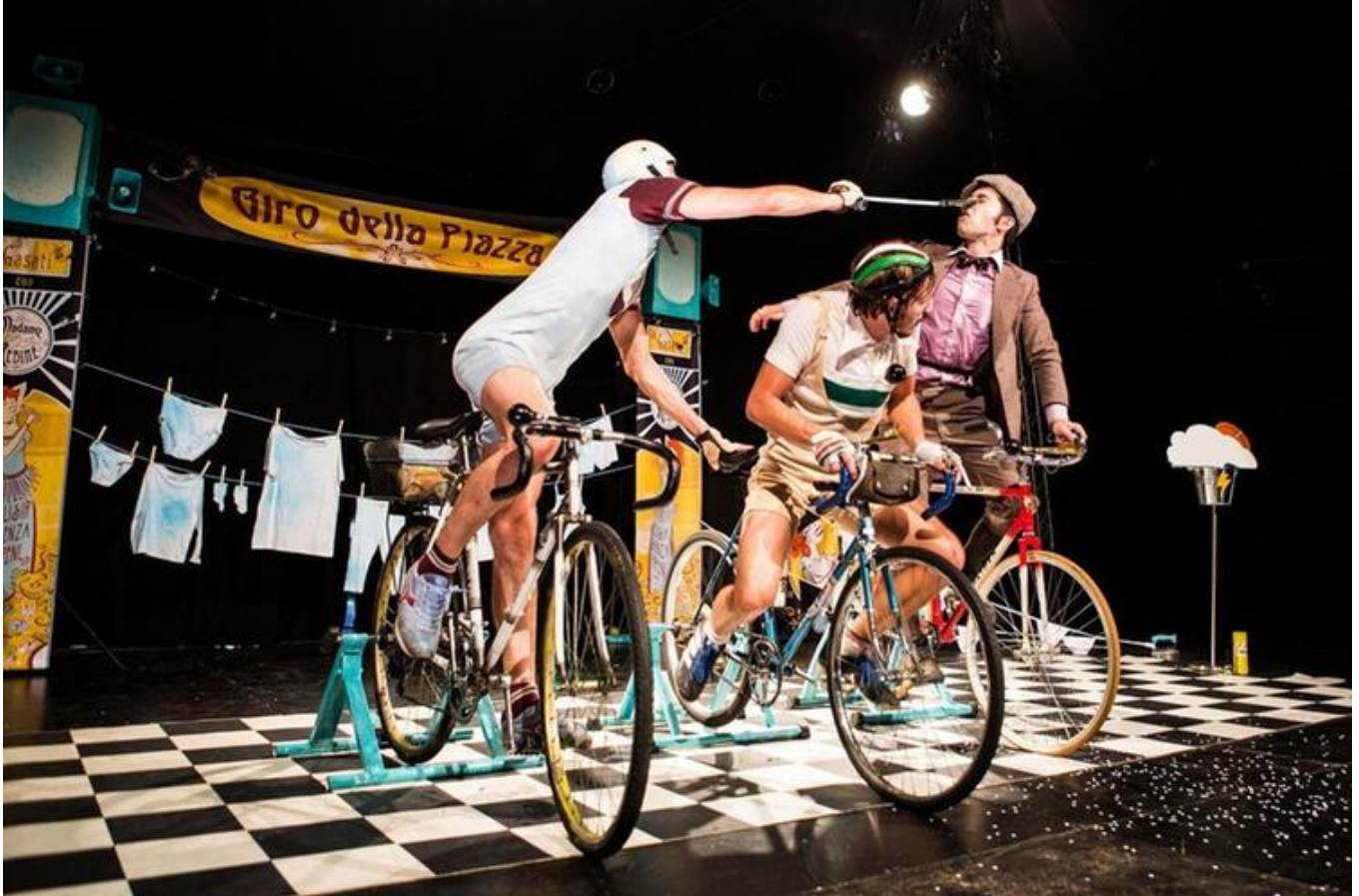
Uno spettacolo della Compagnia Madame Rebinè

Sempre per i più piccolo l'8 dicembre alle 16 in Piazzetta Pallata lo spettacolo « Munuscolo » di Reverie Teatro; stessa ora ma al Quadriportico di Piazza Vittoria « Burattini in carne ed ossa » del Circolino Teatro. L'11 dicembre alle 16 in Piazzetta Michelangeli « Gran Ventriloquini » della Compagnia Madame Rebinè; stessa ora ma al Quadriportico di Piazza Vittoria « Biancaneve » di Reverie Teatro. Infine, il 18 dicembre, sempre al Quadriportico, « La piccola odissea » di Reverie Teatro.